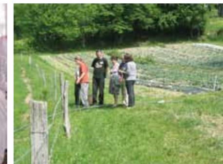
Visites guidées du jardin

Association Pousses d'Avenir 35, impasse des Jardins - Lieudit La Bennaz 74500 Publier jardin@poussesdaenir.org Tel/fax : 04.50.72.76.94