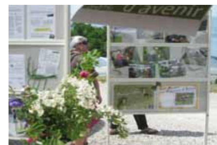
Rétrospective de l'année en photo