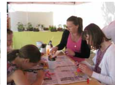
Atelier éco créatif avec les fetards