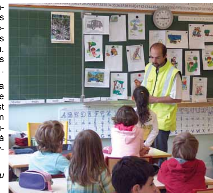
les CP/CE1 de l'école de Lugrin

Pour plus d'infos, contacter les ambassadeurs du tri au 04 50 74 57 90.