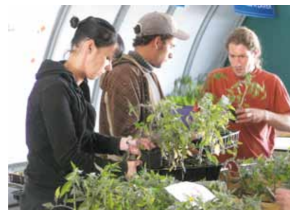
Vente de légumes biologiques