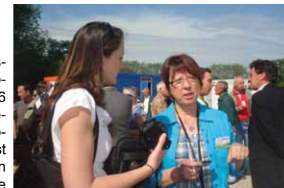
Autour du pot de l'amitié

A l'issue de l'Assemblée Générale, les participants ont échangé autour du Pot de l'Amitié avec les Membres de l'Association. Puis un déjeuner a suivi, réunissant les jardiniers-jardinières et les membres du Bureau, du Conseil d'Administration et les adhérents bénévoles.